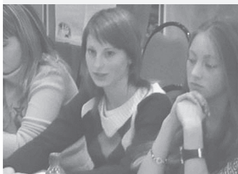
Информ-кафе – это интересно.

Сложной и для подготовки, и для обсуждения оказалась тема «Права учащихся: давайте поговорим открыто». Тема защиты прав учащихся нечасто попадает в поле зрения общественности, ведь скандалы в учебных заведениях – дело обыденное. При этом бесправны и бессильны в любой