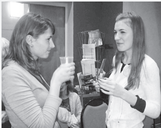
Информ-кафе – это вкусно.

конфликтной ситуации, по сути, все – и учащиеся, и учителя. Право на равенство, право на выражение своего мнения, право на неприкосновенность частной жизни, а также – что делать, если тебе нанес оскорбление учитель или одноклассник, как вести себя, если тебя унижают, что предпринять, если конфликтная ситуация вышла из под контроля? Эти и другие вопросы обсуждались на круглом столе в Информ-кафе. На