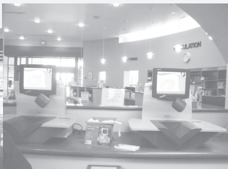
Автоматизированная книговыдача в Публичной библиотеке графства Томкинс.

ния города мы не наблюдали. Наверно, нет проблем. Может, и мы доживем до таких времен. Все офисы очень красивые, помещение для заседаний выдержано в классическом стиле, с дубовой мебелью, кресла обтянуты кожей, герб графства, телекамеры повсюду. Заседания идут в записи на местном телевидении и не прерываются рекламой, поэтому члены законодательного собрания чрезвычайно популярны у жителей города, все их знают в лицо, и они доступны для населения.