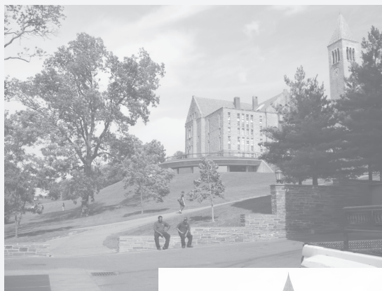
Главная достопримечательность города – Корнельский университет

учится порядка двадцати тысяч студентов со всего мира, кроме России. Говорить о Корнеле, рассказать о библиотеке университета в двух словах невозможно. Только небольшие детали: огромный кампус со своим транс-