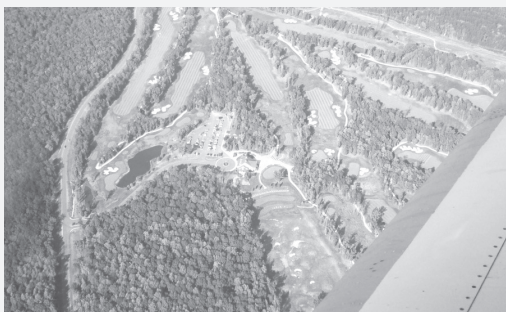
Под крылом самолета — одноэтажная Америка.

пешно. Можете себе представить самолетную пробку? До визита в Америку — я не могла, оказывается, бывает и такое — стоишь в самолетной пробке и ждешь своей очереди на взлет, самолетов, этак, десять на перекрестке взлетной полосы. Здесь самолет — воздушный трамвай: не успел взлететь — уже посадка. 20 минут полета — и на выход.