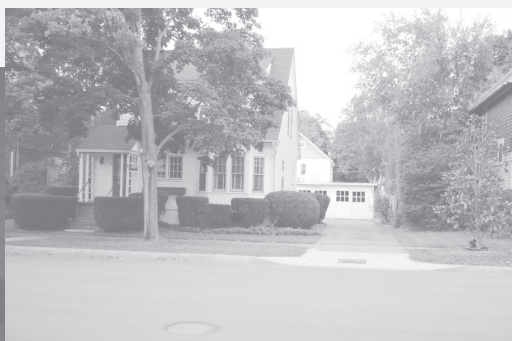
Старый город, «таун хаус» Итаки - типичная одноэтажная Америка, которую мы видим в американских фильмах.

портом, корпусами, инфраструктурой, стадионами, телескопом, оранжереей. Девятнадцать университетских библиотек, огромный музей со смотровой площадкой, есть даже свой Биг-Бен, трехэтажный магазин с товарами университетской символики (продается все, на что можно поставить логотип университета).