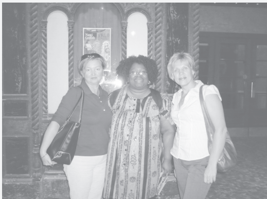
Я жила в семье Патрис. Колоритная, веселая, без комплексов дама средних лет.

Так вот, на чем я остановилась? Наверно, это поверхностный взгляд на американский образ жизни, который не позволяет увидеть их проблемы. У кого сегодня нет проблем? Однако даже при поверхностном знакомстве (десятидневная поездка), все-таки можно представить, что живет-то им в целом неплохо. Есть примерно пара процентов людей очень богатых, пара процентов очень бедных. Первые обеспечивают себя сами, вторых обеспечивает государство, прослойка между ними живет примерно одинаково: кто-то имеет страховку, кто-то получает ее от работодателя, кто-то рассчитывает на себя. В целом получается среднестатистический американец, который живет для себя, не обременен бытовыми проблемами, окружающий мир полностью приспособлен для него. Правда, у американцев много обязанностей и ограничений по отношению к окружающему миру: соблюдать чистоту вокруг, не оставлять детей до 12 лет без присмотра