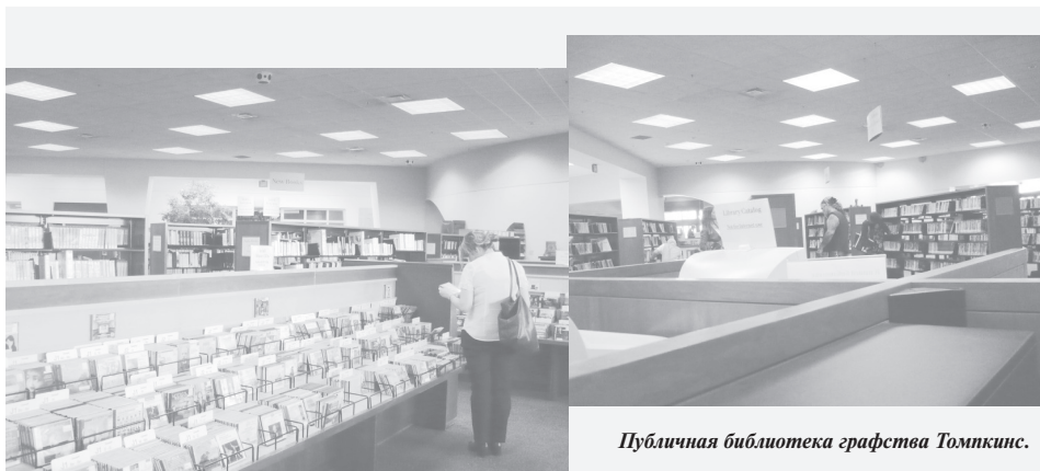
Публичная библиотека графства Томпкинс.

му что тут же осознали, что господин воспитывался в американской стране, и подозревать его в том, о чем мы подумали, это все равно, что подозревать ребенка в шпионаже в пользу инопланетян.