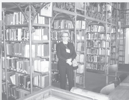
Университет имеет девятнадцать библиотек. Представляем две из них.