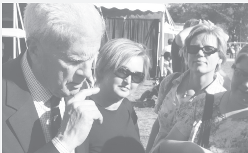
Джеймс Биллингтон, директор библиотеки Конгресса США, с группой российских библиотекарей, г. Вашингтон, 2007 год.

Как говорится, повезло. Программа «Открытый мир» предоставила нам — группе российских библиотекарей — уникальную возможность увидеть, узнать, сравнить, открыть свою Америку.